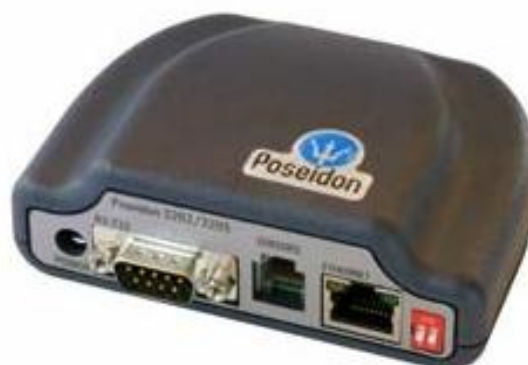
Rys.2 Widok kontrolera nadzoru Poseidon 3262

Urządzenie przeznaczone jest do monitorowania warunków klimatycznych pomieszczeń. Umożliwia kontrolę temperatury i wilgotności oraz definiowanie progów alarmowych. Po wykryciu stanu alarmowego automatycznie przesyła informację (trap SNMP) do systemu zarządzania (użytkowników). Dodatkowo może wysyłać e-maila lub SMS-y (wykorzystując oprogramowanie SCS Win lub PD Triger). Kontroler umieszczony jest w estetycznej wolnostojącej obudowie i zasilany napięciem 12V DC.