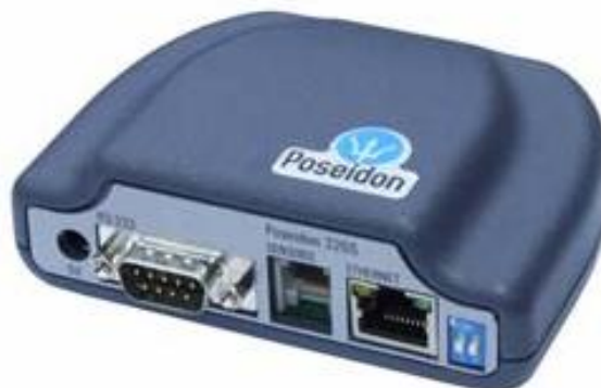
Rys.2 Widok kontrolera nadzoru Poseidon 3265

Urządzenie przeznaczone jest do monitorowania warunków klimatycznych pomieszczeń. Umożliwia kontrolę temperatury i wilgotności oraz definiowanie progów alarmowych. Po wykryciu stanu alarmowego automatycznie przesyła informację (trap SNMP) do systemu zarządzania (użytkowników). Dodatkowo może wysyłać e-maila lub SMS-y. Użytkownik może być powiadamiany o zaistniałych zdarzeniach alarmowych poprzez dwa niezależne media komunikacyjne (Ethernet, GSM). Kontroler umieszczony jest w estetycznej wolnostojącej obudowie i zasilany napięciem 12V DC.